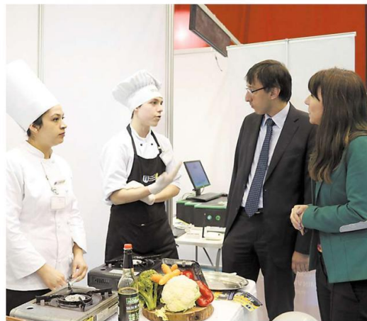
Estudiantes de diversas comunas de la región se congregaron en este encuentro de Educación Técnico Profesional.

En 2019 se cumplen 77 años desde que el Presidente Juan Antonio Ríos reconoció la importancia de la Educación Técnica en el desarrollo productivo del país, a través de la creación de la Dirección General de Enseñanza Profesional, lo que ocurrió el 26 de agosto de 1942.