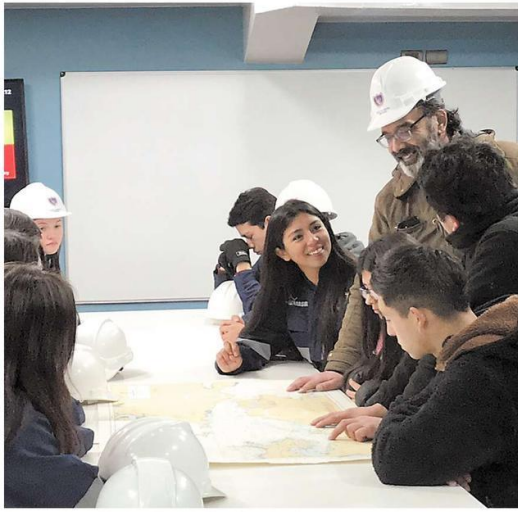
La zona sur austral que mira el continente desde el mar, es la esencia de la asociación y es por ello su compromiso con las educación TP.

A partir del paralelo 41, donde se ubica Puerto Montt, Chile se desmembra, y el principal modo de conectividad en este tramo es la marítima.