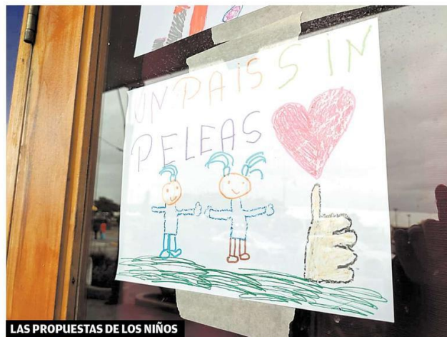
LAS PROPUESTAS DE LOS NIÑOS

Los niños también están pidiendo un espacio para plantear sus demandas, en este actual contexto de descontento social que vive Chile. "Un país sin peleas", como indica este cartel pegado en la Casa del Arte Diego Rivera, demuestra la urgente necesidad de trabajar por un país más unido y donde prevalezca la justicia.