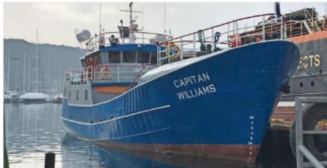
Armasur creó el año pasado el Buque de Instrucción Marítima BIM Capitán Williams, el primer buque escuela civil de Chile.