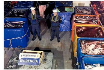
EN AGOSTO SE DECOMISARON DE 25 TONELADAS DE SALMONES EN QUELLÓN.

-Realizaron buen trabajo, diligenciando 30 órdenes de investigar del Ministerio Público. Con golpes fuertes, decomisamos 25 toneladas de salmón en una sola embarcación -12 de agosto pasado en Quellón- que venían robados desde Aysén y que fue seguida por el golfo de Corcovado, con dos patrullas y