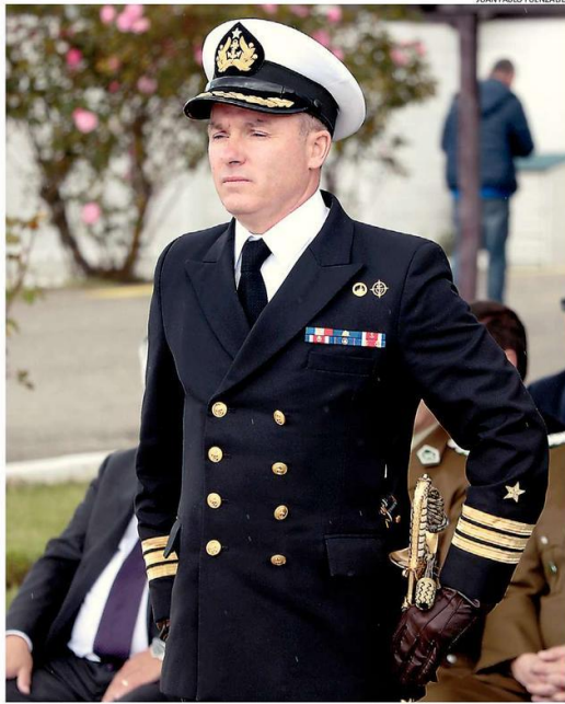
EL OFICIAL DETALLÓ LAS ACTIVIDADES REALIZADAS EN LA GUARNICIÓN NAVAL CHILOÉ.

“Se actuó de gran forma, en la primera instancia no hubo problemas de seguridad ni contaminación, mientras que por la festividad hicimos gestiones con Armasur que donó más de 500 salvavidas al municipio de Quinchao para ser puestos a disposición de los peregrinos”, ex-