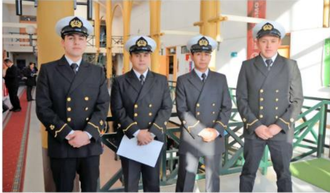
Primeros técnicos universitarios en Transporte Marítimo Costero del ITR ULagos.

Las carreras son dictadas por el Instituto Tecnológico Regional (ITR) de la Ulagos en Puerto Montt y cumplen con los requerimientos exigidos por la Autoridad Marítima. Hoy, ya existen generaciones de egresados en ambas especialidades, con prácticamente un 100% de empleabilidad y una demanda creciente que garantiza para quien elige estudiar en ella un futuro que combina pasión por el mar, estabilidad laboral y económica. Son profesionales cada vez más necesarios para la Marina