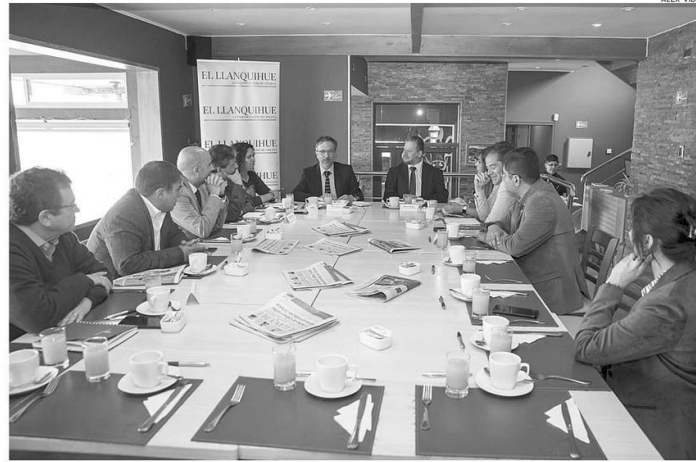
ACTORES DEL SECTOR PÚBLICO Y PRIVADO PARTICIPARON DEL PRIMER DIÁLOGO REGIONAL DEL AÑO.

ANÁLISIS. Educación, sustentabilidad y desarrollo urbano serán algunos de los temas que se seguirán abordando este año en esta instancia liderada por El Llanquihue.