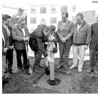
CASI UNA CINCUENTENA DE PACIENTES SE ATENDERÁN EN EL LUGAR.