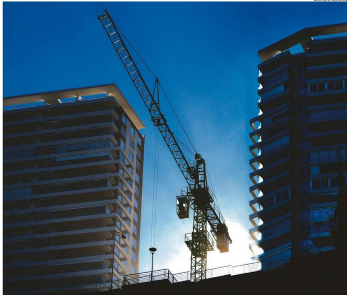
AGILIZAR LOS PROYECTOS DE INVERSIÓN ES UNO DE LOS OBJETIVOS QUE PERSIGUE LA INICIATIVA GUBERNAMENTAL.

Otro punto que destacó se orienta a los cambios que se realizarán para las compras públicas y que tienen relación con evitar la concentración en los proveedores. "Hay una demanda que siempre nos comentaban las pymes de la región sobre el portal ChileCompra, pues en la Región de Valparaíso existen más de 5.000 proveedores inscritos en el sitio, de los cuales el 96% son pymes. Esta demanda se relacionaba con el acceso a este instrumento. Y es por eso que vamos a hacer