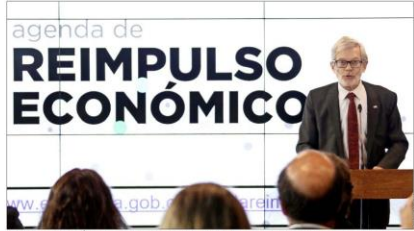
REIMPULSO ECONOMICO.—El ministro de Economía, Juan Andrés Fontaine, dio a conocer ayer el detalle de la agenda de reimpulso económico, en dependencias de Start-Up Chile.

La agenda de reimpulso económico recoge propuestas de diferentes fuentes. Todo esto inspirado en el trabajo que se