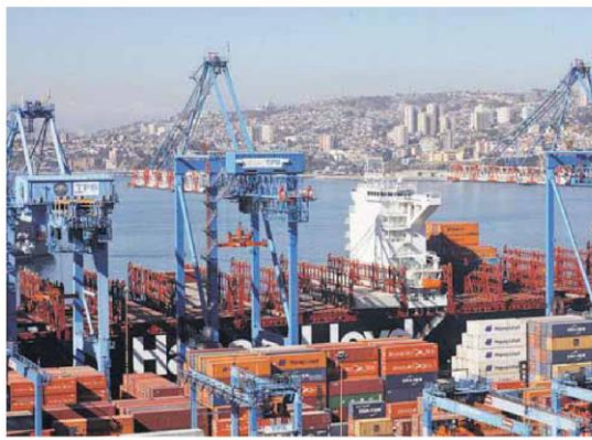
14 millones de toneladas se trasladan anualmente vía marítima.